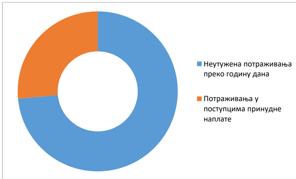
Графикон број 2: Однос неутужених потраживања преко годину дана и ненаплаћених потраживања у поступку принудне наплате